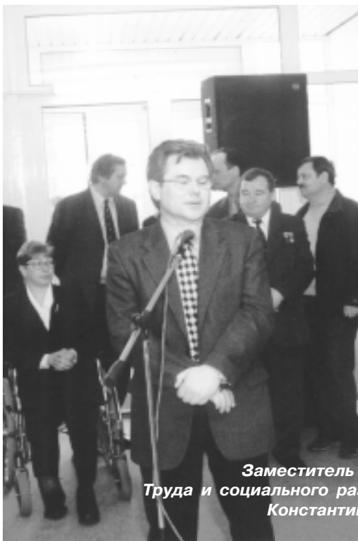
Заместитель Министра Труда и социального развития РФ Константин ЛАЙКАМ