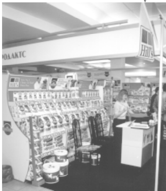
Один из лучших стендов выставки представила компания «ВАЛТА Пет Продактс» (Москва)

Поэтому отраднo было видеть представителей развиваю-