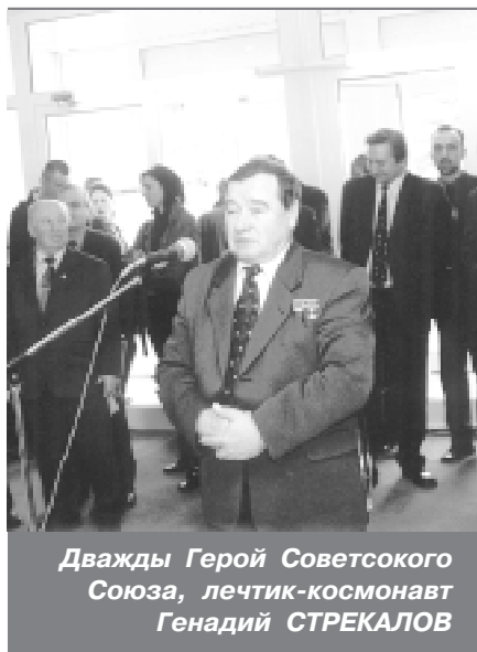
Дважды Герой Советского Союза, лётчик-космонавт Геннадий СТРЕКАЛОВ

Свою продукцию представили свыше 80 предприятий зооиндустрии из Москвы и многих регионов России. Зарубежные компании были представлены стендами своих российских представительств, среди них особенно выделялся стенд транснационального гиганта – “Марс”, представлявшего на выставке корма и аксессуары под марками “Pedigree”, “Whiskas”, “Ket-e-Kat” и др.